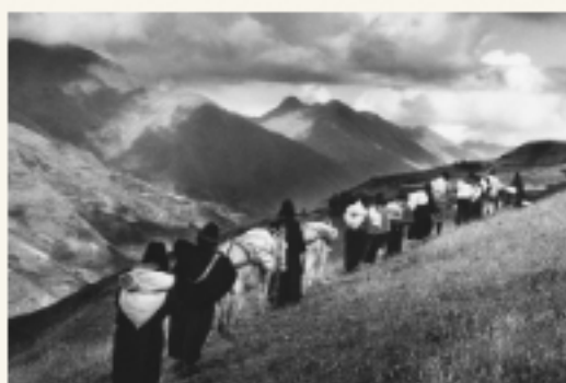
SÉRIE "LUTTE POUR LA TERRE"

Elle est organisée en trois séries dans nos fonds :